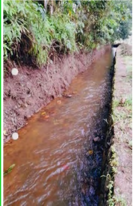
തോട് നവീകരണം പത്തളം നഗരസഭ