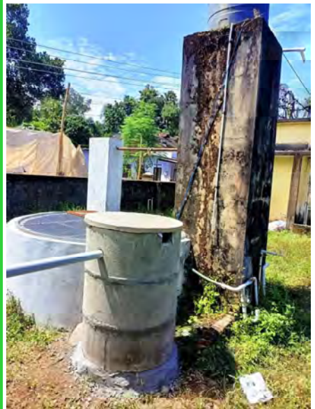
കിണർ റീ ചാർജ്ജിംഗ് കോട്ടയം നഗരസഭ