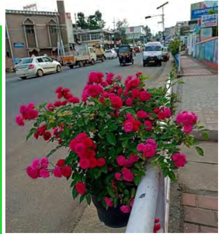
നഗര സൗന്ദര്യവൽക്കരണം സുൽത്താൻ ബത്തേരി നഗരസഭ