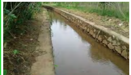
തോട് നവീകരണം ആറ്റിങ്ങൽ നഗരസഭ