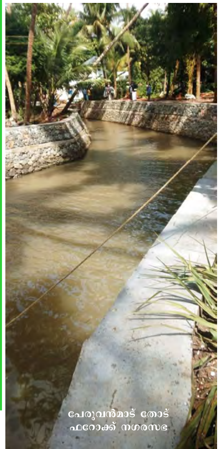
പേരുവൻമാട് തോട് ഫറോക്ക് നഗരസഭ