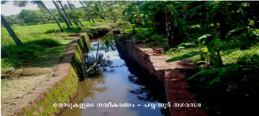
തോടുകളുടെ നവീകരണം - പയ്യന്നൂർ നഗരസഭ

ജല ശക്തി അഭിയാൻ ലഘുപദ്ധതി നടപ്പിൽ വരുത്തിയതോടെ നഗരമേഖലയിലെ ജല സ്രോതസ്സുകളുടെ വർത്തമാനകാല സാഹചര്യം കൂടി മനസ്സിലാക്കുവാൻ നഗരസഭ കൾക്ക് കഴിഞ്ഞു. ജീവന്റെ അമൂല്യമായ ജലം സംരക്ഷിക്കേണ്ടതിന്റെ പ്രാധാന്യം സമൂഹത്തിന് കാട്ടികൊടുക്കുവാനും ഒരു പരിധിവരെ സാധിച്ചിട്ടുണ്ട്.