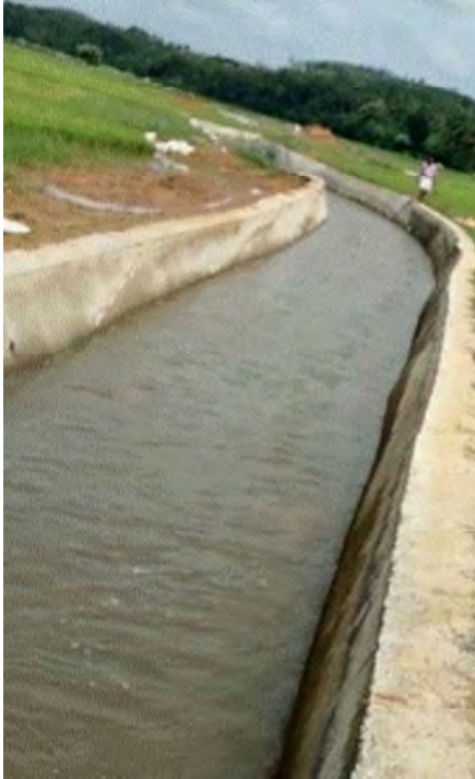
തോട് നവീകരണവും മഴവെള്ളക്കൊയ്ത്തും വടക്കാഞ്ചേരി നഗരസഭ