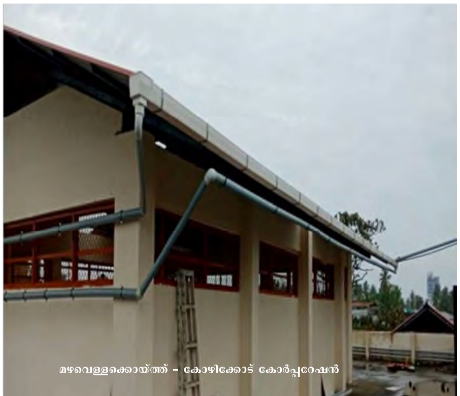
മഴവെള്ളക്കൈയ്ത്ത് - കോഴിക്കോട് കോർപ്പറേഷൻ

മഴവെള്ള കൈയ്ത്ത്, സംസ്കരിച്ച മലിനജലത്തിന്റെ പുനരുപയോഗം, പ്ലാന്റേഷൻ, കിണറുകൾ/കുളങ്ങൾ റീ ചാർജ്ജ് ചെയ്യുന്നതിന് ശുദ്ധ ജല ചാലുകൾ നിർമ്മിക്കുക, ജലാശയങ്ങളുടെ പുനരുജ്ജീവനം, ജലസംരക്ഷണത്തിനുള്ള പുനരധിഷ്ഠിപ്പിക്കൽ സൃഷ്ടിക്കുക, ജൽശക്തി പാർക്കുകൾ നിർമ്മിക്കുക തുടങ്ങി കേന്ദ്രസർക്കാർ പദ്ധതിയ്ക്കായി നിശ്ചയിച്ച 7 മുൻഗണനാ മേഖലകളിലെ പദ്ധതികളാണ് നഗരസഭകൾ നടപ്പിലാക്കിയത്.