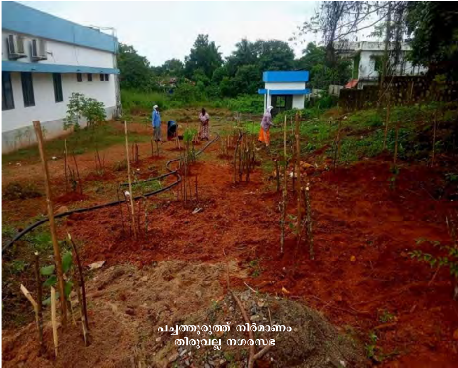
പച്ചത്തുരുത്ത് നിർമ്മാണം തിരുവല്ല നഗരസഭ

തെക്കൻ മേഖലയിൽ കുളങ്ങളുടെ നവീകരണം, വൃക്ഷത്തൈകൾ വെച്ചു പിടിപ്പിക്കൽ തുടങ്ങി വിവിധ പദ്ധതികൾ നടപ്പിലാക്കിയ തിരുവനന്തപുരം കോർപ്പറേഷനെ ഏറ്റവും നല്ല രീതിയിൽ പദ്ധതികൾ നടപ്പിലാക്കിയ കോർപ്പറേഷനായി തെരഞ്ഞെടുത്തു.