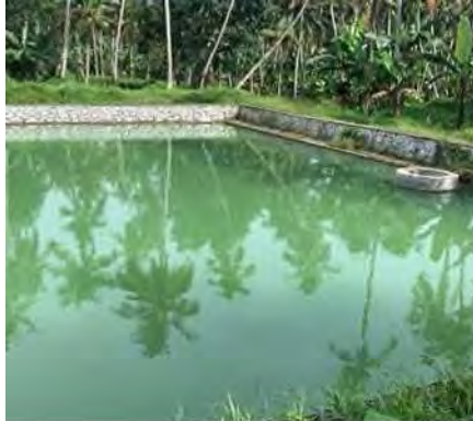
തിരുവനന്തപുരം കോർപ്പറേഷൻ ജൽ ശക്തി അഭിയാൻ പദ്ധതിയിലുൾപ്പെടുത്തി നടപ്പിലാക്കിയ വിവിധ പദ്ധതികൾ