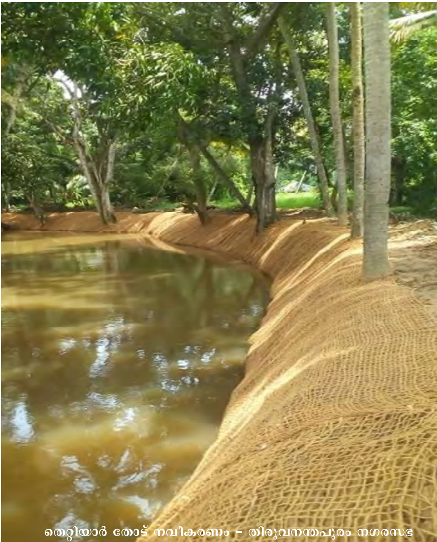
തെറ്റിയാർ തോട് നവീകരണം - തിരുവനന്തപുരം നഗരസഭ

പദ്ധതികളുടെ തിരഞ്ഞെടുപ്പിൽ മാത്രമല്ല കേന്ദ്ര സർക്കാർ നിശ്ചയിച്ച സമയ പരിധി കുള്ളിൽ പദ്ധതികൾ പൂർത്തിയാക്കാനും നമ്മുടെ നഗരസഭകൾക്ക് കഴിഞ്ഞു. പദ്ധതി യുടെ വിജയത്തിനായി പരിശ്രമിച്ച എല്ലാവർക്കും അഭിനന്ദനങ്ങൾ. പദ്ധതി ആവിഷ്ക രിച്ചതിലെ വൈവിധ്യം, പുതിയ ആശയങ്ങൾ, പരിസ്ഥിതി സൗഹാർദ്ദം, അടങ്കൽ തുക, സമയബന്ധിതമായി പദ്ധതി പൂർത്തിയാക്കൽ തുടങ്ങിയ ഘടകങ്ങൾ പരിഗണിച്ച് നഗര സഭകൾക്ക് ഒന്നും രണ്ടും സ്ഥാനങ്ങൾ നൽകി ആദരിച്ചു.